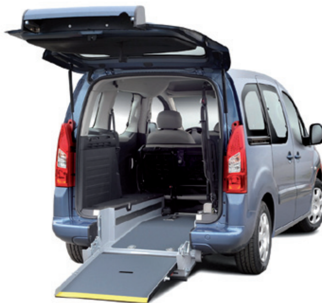
API CZ – Peugeot

API CZ je česká firma se světovým významem – na jejím úspěchu se od samého založení zásadně podílí software Autodesk Inventor.