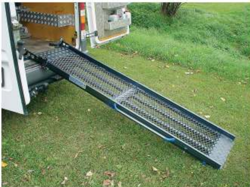
Úzká rampa pro nakládání nap . motorek.