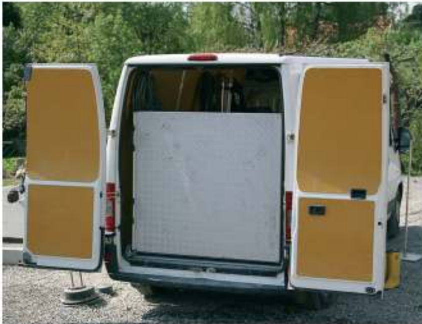
Extra široká rampa s povrchovou úpravou.