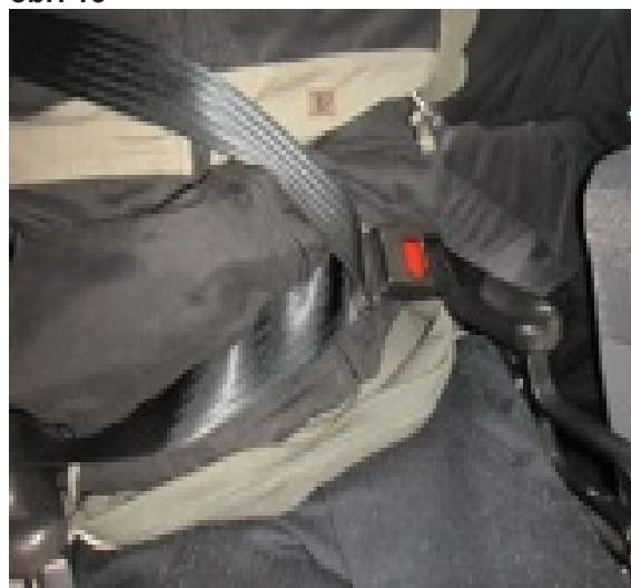
Detail spojení ramenního a břišního pásu