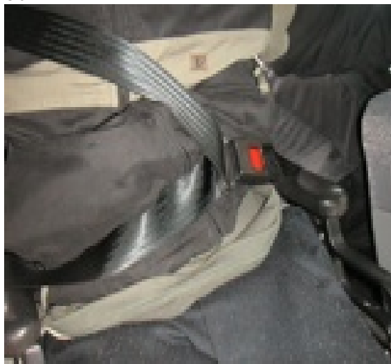
Připoutejte osobu na vozíku ramením bezpečnostním pásem. Zaklopte plošinu zpět do vozu.