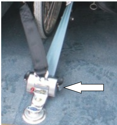
Detail upoutání břišního pásu.